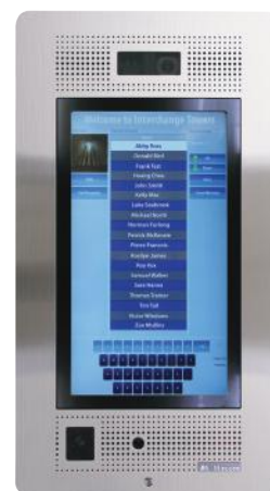
TX3-TOUCH-F22 (Montage encastré)