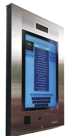
TX3-TOUCH-S22 (Montage en surface)