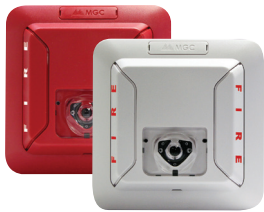
Alarmas visuales para montaje en techo