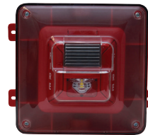
Protegido del clima Alarmas visuales para montaje en pared