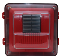
Protegido del clima Altavoz de pared/techo