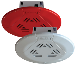
Altavoz Para Techo

Los altavoces y los altavoces con estrobo de MGC cumplen los requisitos de las agencias, incluidas las normas NFPA 72, UL 1971, UL1638, UL1480, ULC S526 y ULC S541.