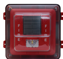
Protegido del clima Altavoz con estrobo para pared