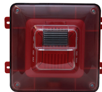
Protegido del clima Alarma audible para montaje en techo o pared