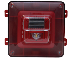
Protegido del clima Alarmas audiovisuales para montaje en pared