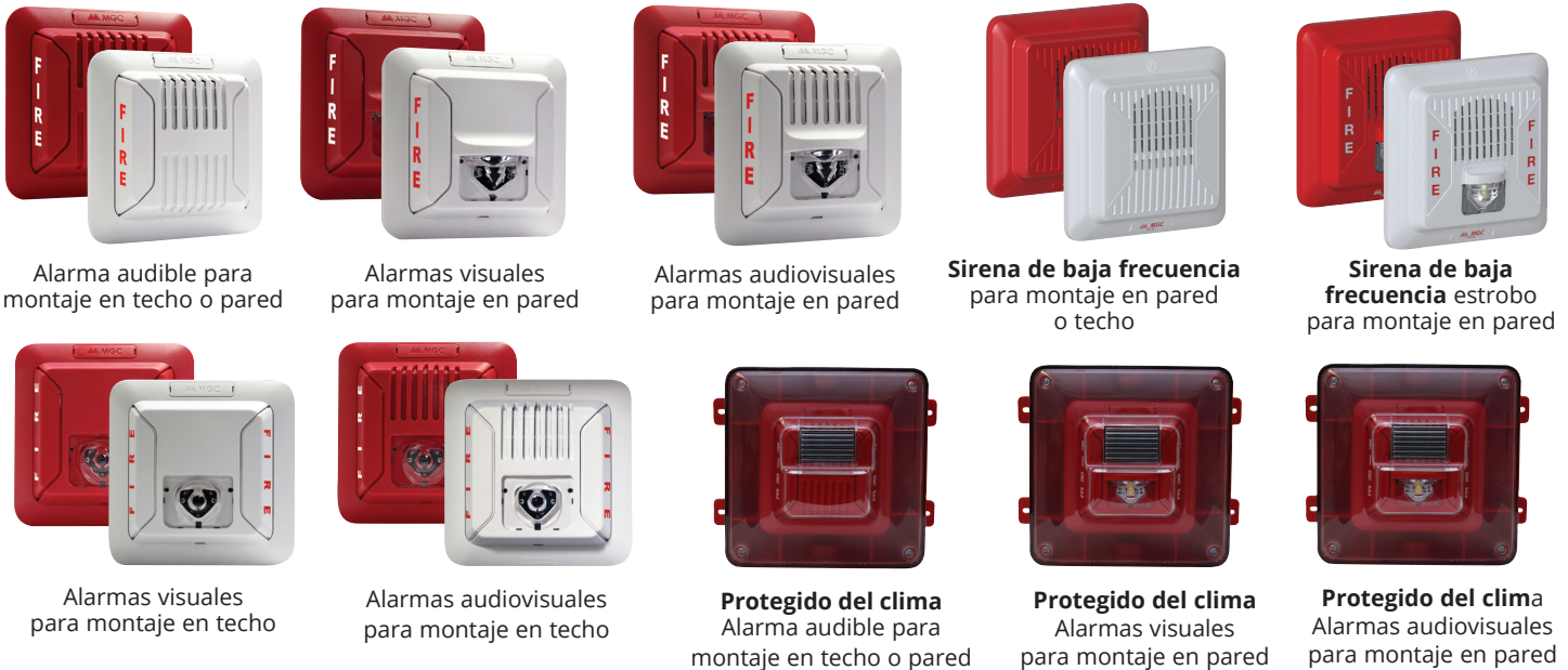
Alarma audible para montaje en techo o pared

Diseñados para aplicaciones interiores/exteriores de montaje en pared o techo, los dispositivos de notificación de MGC cumplen los requisitos de las agencias, incluidas las normas NFPA 72, UL 1971, UL 1638, UL 464, ULC 5525 y ULC 5526.