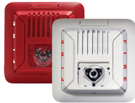
Alarmas audiovisuales para montaje en techo