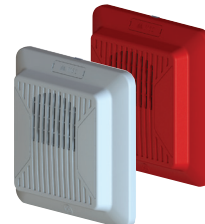
Altavoz para pared