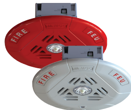
Altavoz con estrobo Para Techo