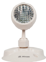
EL-7030A (1,5 W)