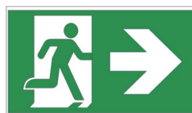
Avec Flèche 2 pièces