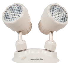
EL-7030B (3 W)