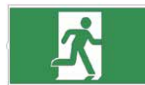
Sans Flèche 1 pièce