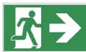
Avec Flèche 2 pièces