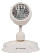
EL-7030A (1,5 W)