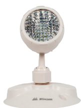
EL-7030A (1,5W) EL-7030A5 (5W)

L'unité est livrée avec deux têtes d'éclairage à distance de 10 W attachées. Vous pouvez ajouter jusqu'à 700 W de télécommandes supplémentaires pour 30 minutes, comprenant l'une ou l'autre ou une combinaison des éléments suivants :