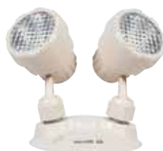
EL-7030B (3 W)