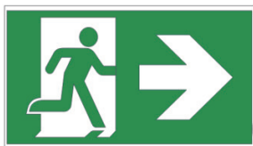
Avec Flèche 2 pièces