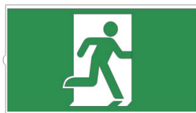
Sans Flèche 1 pièce