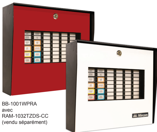
BB-1001WPRA avec RAM-1032TZDS-CC (vendu séparément)