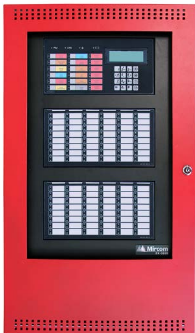
FX-3500 con dos módulos RAX-1048TZDS opcionales