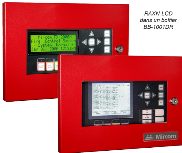
RAXN-LCDG dans un boîtier BB-1001DR