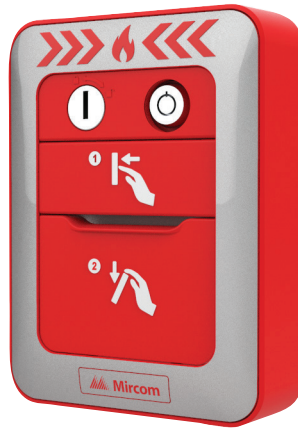
MPS-802MP 2 étapes