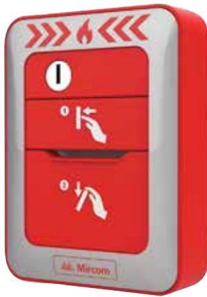
MPS-810MP(U) 1 étape