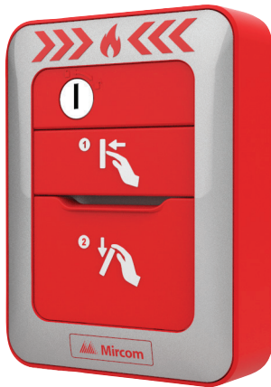
MPS-810MP(U) 1 étape