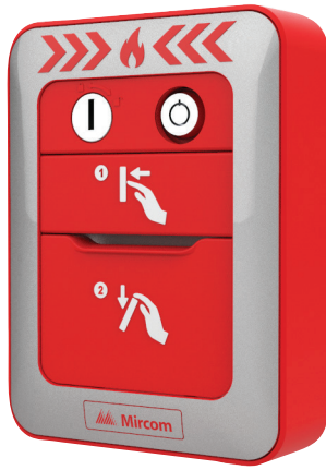
MPS-802MP 2 étapes