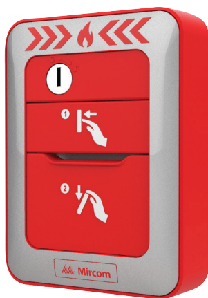
MPS-810MP(U) 1 étape