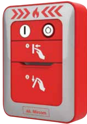
MPS-802MP Dos Etapas