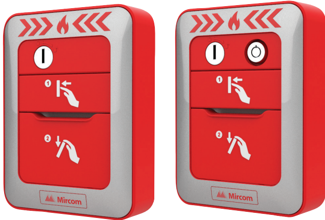
MPS-810MP(U) Una Etapa