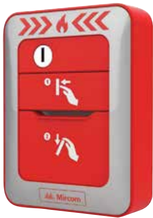
MPS-810MP(U) Una Etapa