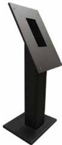
TX3-T-KIOSK2 Piédestal noir en option