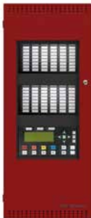
FX-2003-12NXTDS in a BBX-1024XTR enclosure with two optional RAXN-1048TZDS modules